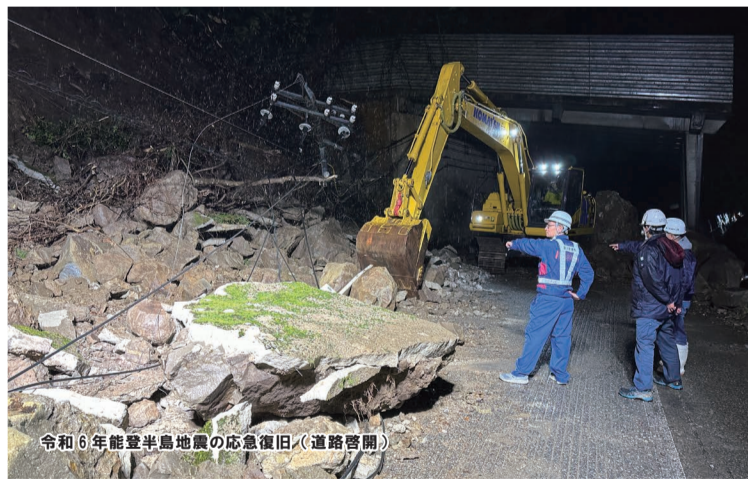
令和6年能登半島地震の応急復旧(道路啓開)