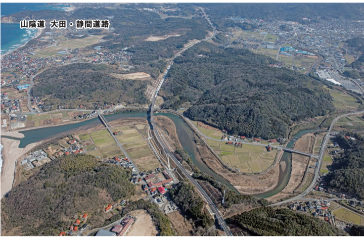
山陰道 大田・静岡道路