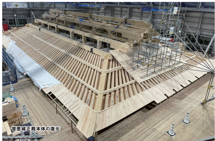
首里城正殿本体の復元