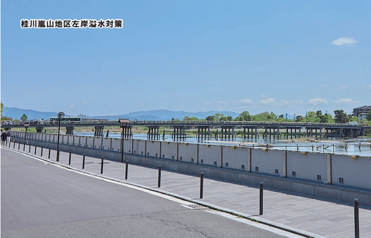
桂川嵐山地区左岸治水対策