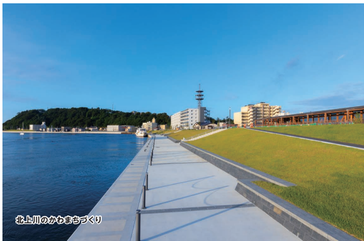
北上川のかまちづくり