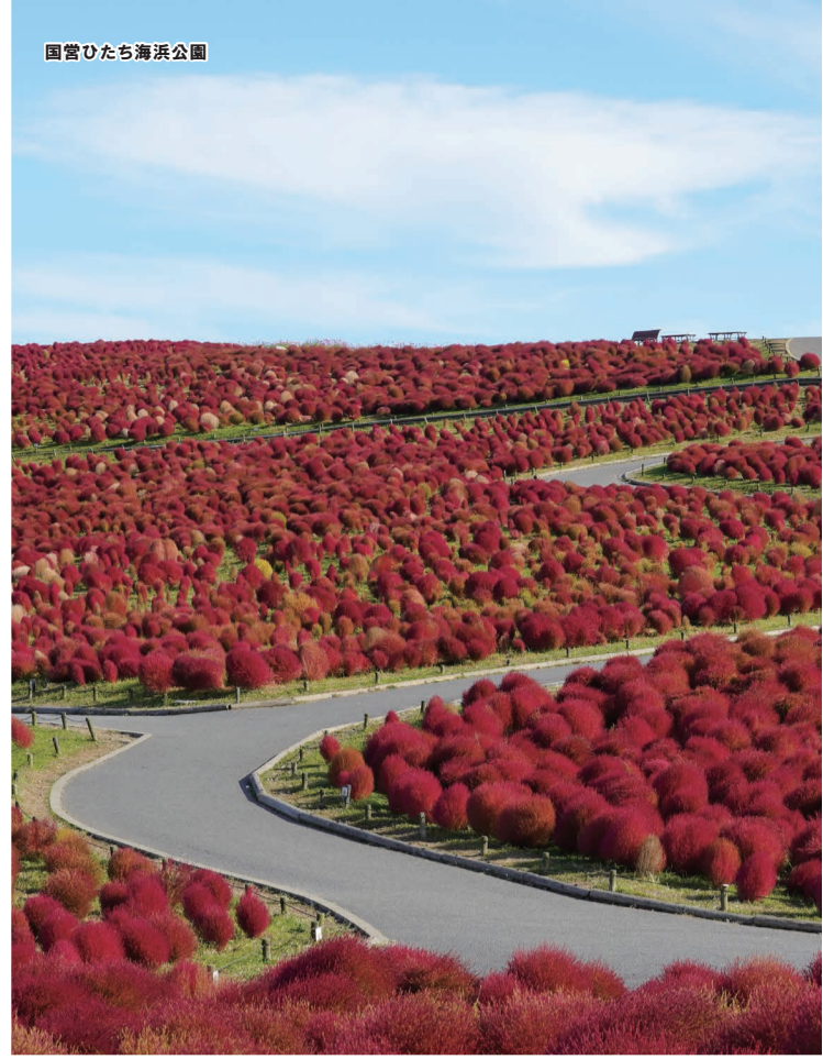
国営ひたち海浜公園