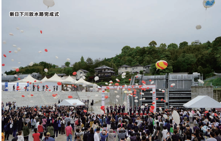
新日下川放水路完成式